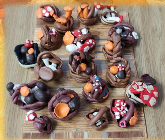
Лепка «Грибы в лукошке»