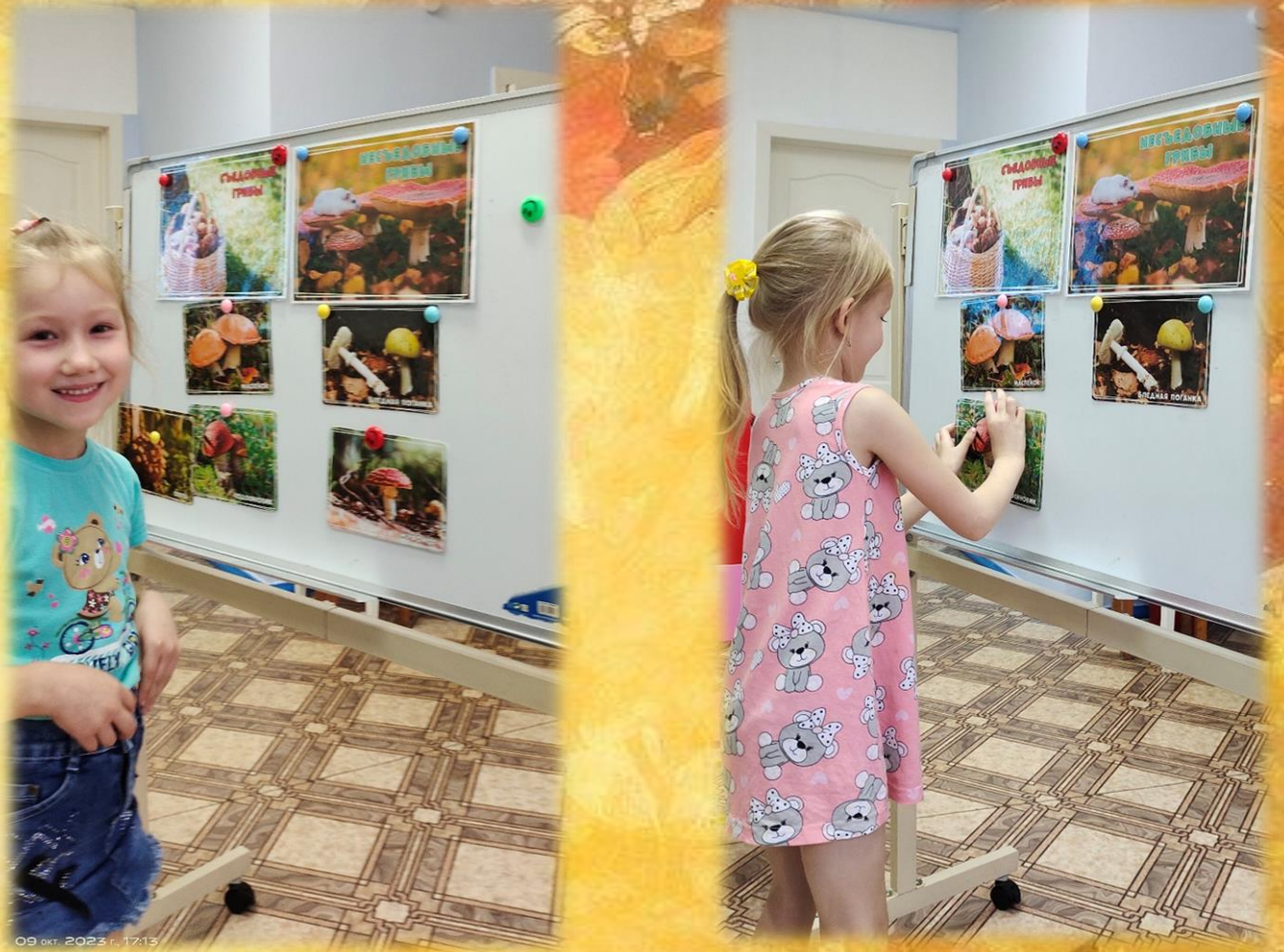
Дидактическая игра «Съедобные и несъедобные грибы»