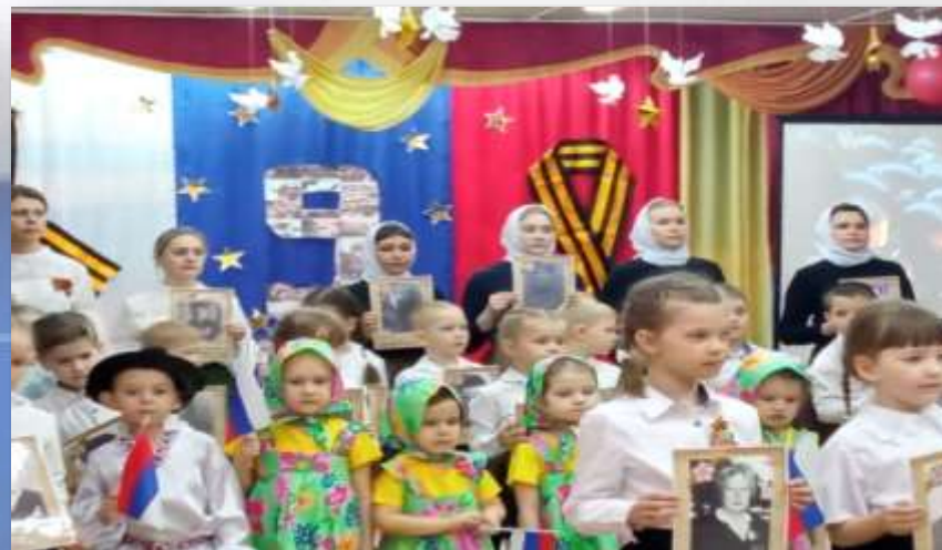
Концерта к 9 мая.