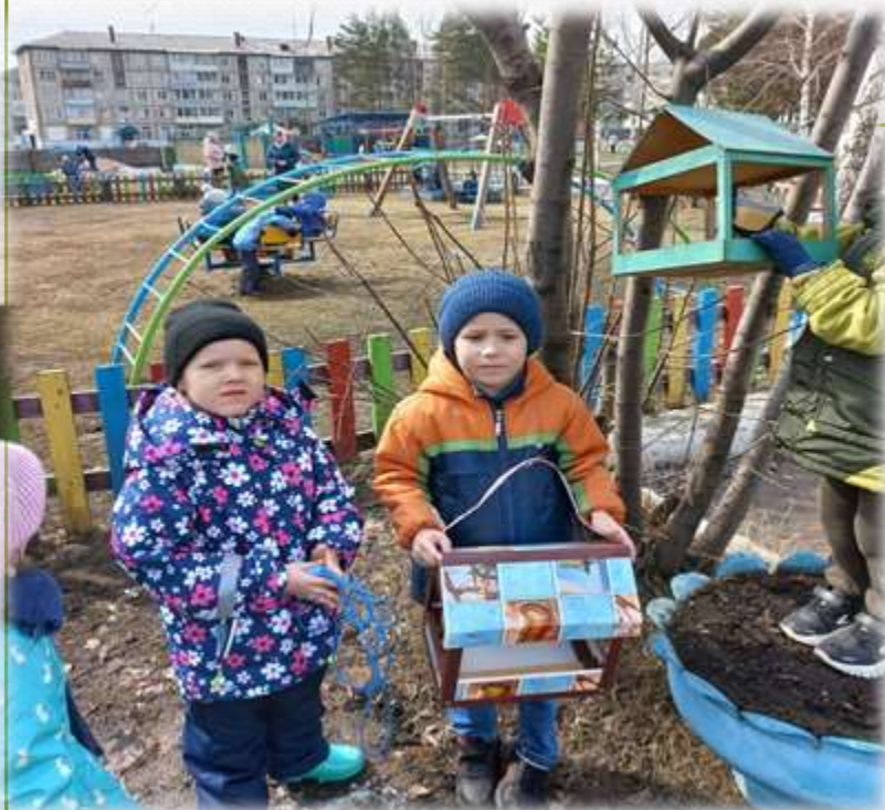
Акции: «Накормим птиц»