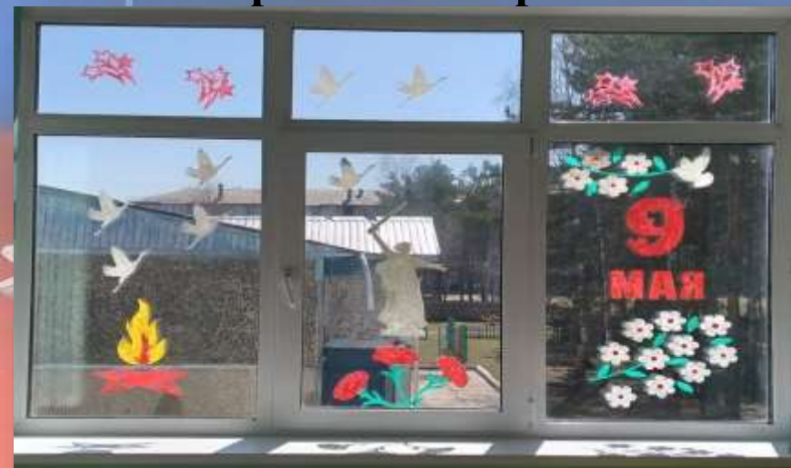
Акция «Окна Победы»