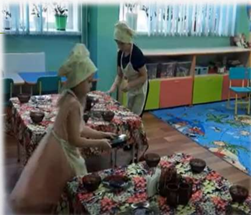
Дежурство в группе