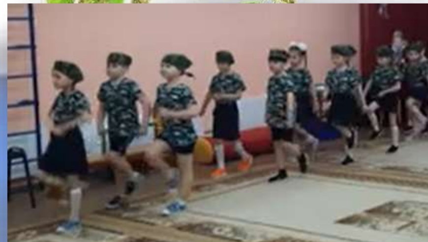
«Смотр песни и строя»