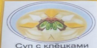
Суп с клецками