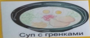
Суп с гренками