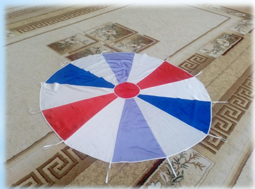
Малый «Парашют здоровья»