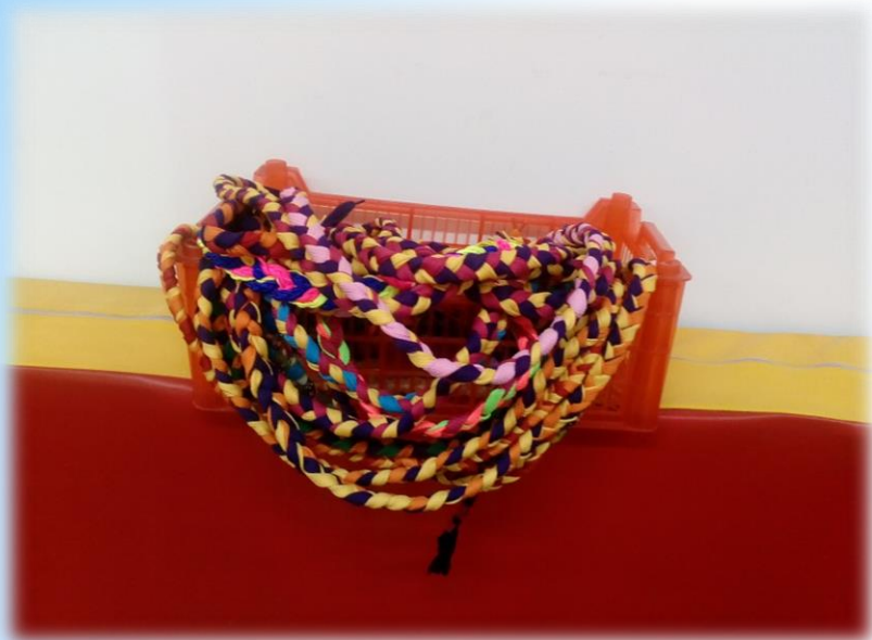
Косички для ОРУ и ОВД