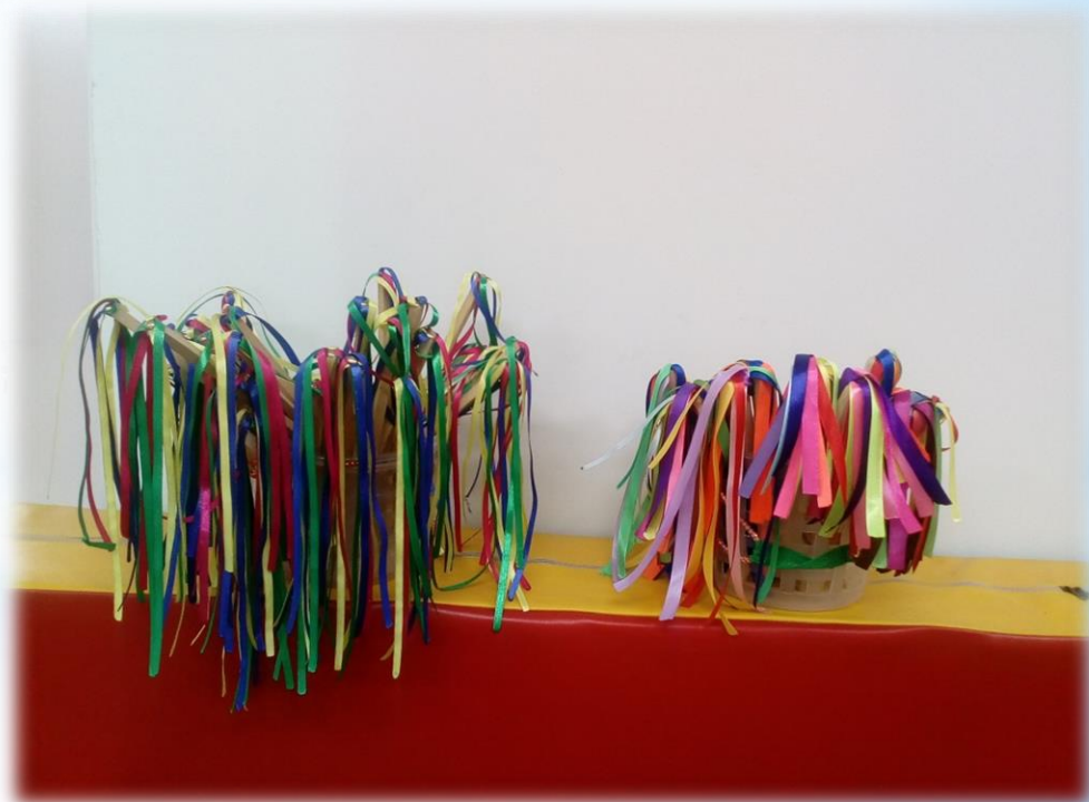
Султанчики для ОРУ