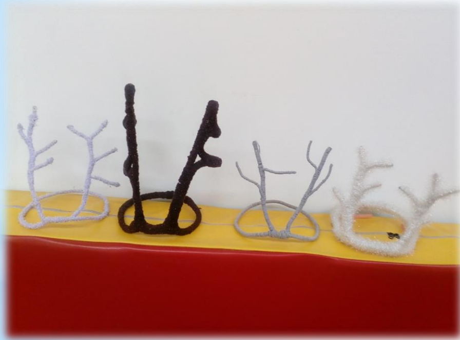
Для подвижных игр народов Севера.