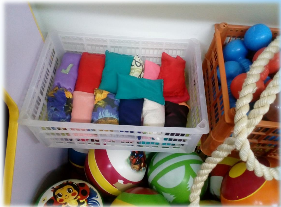
Мешочки с песком, крупой.