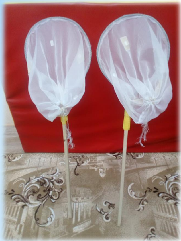
Сачки для эстафет.