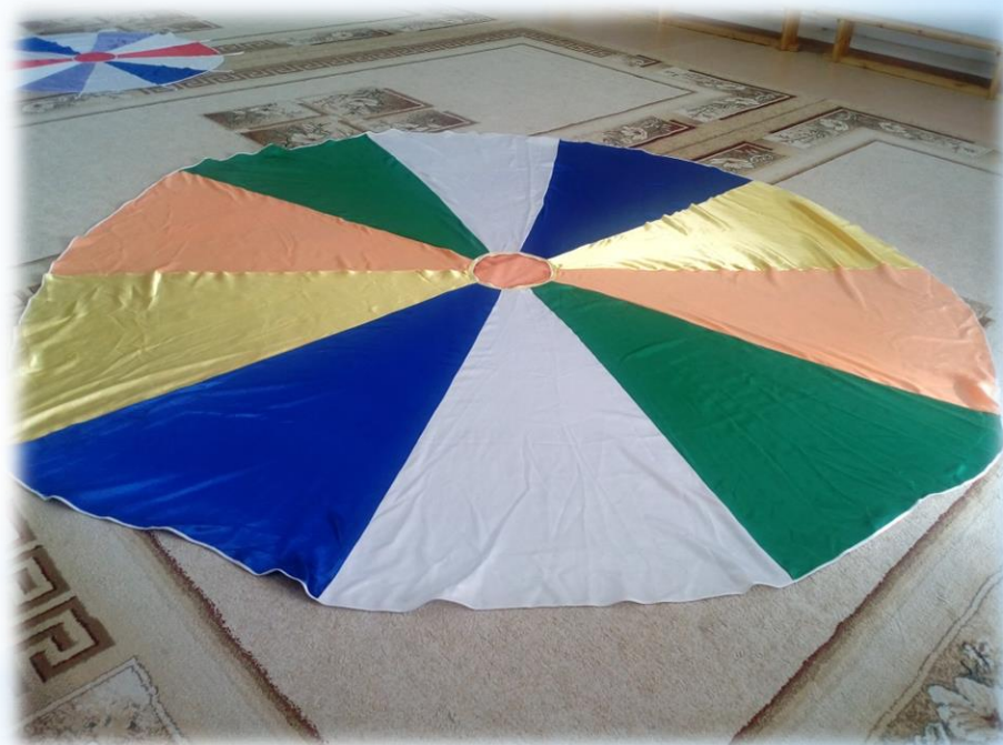
Большой «Парашют здоровья»