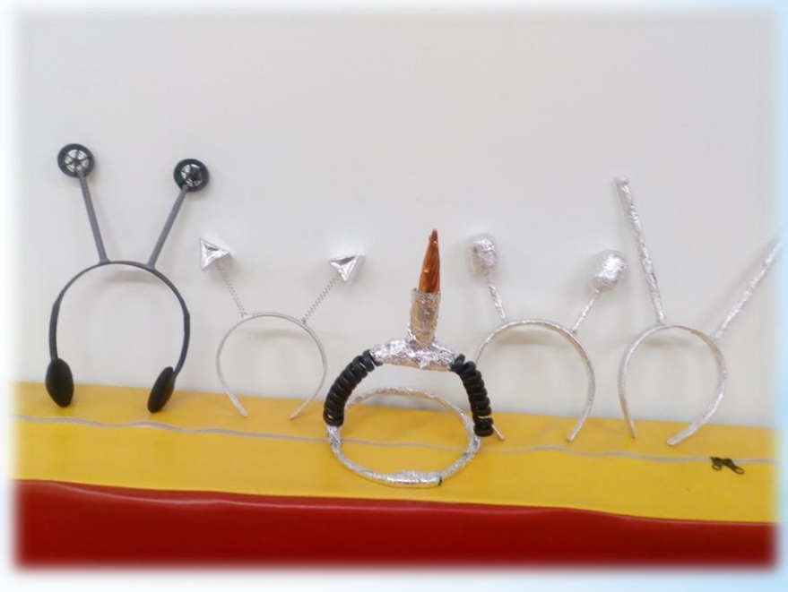
Мы и роботы и космонавты, Ждут нас ракеты и старты.